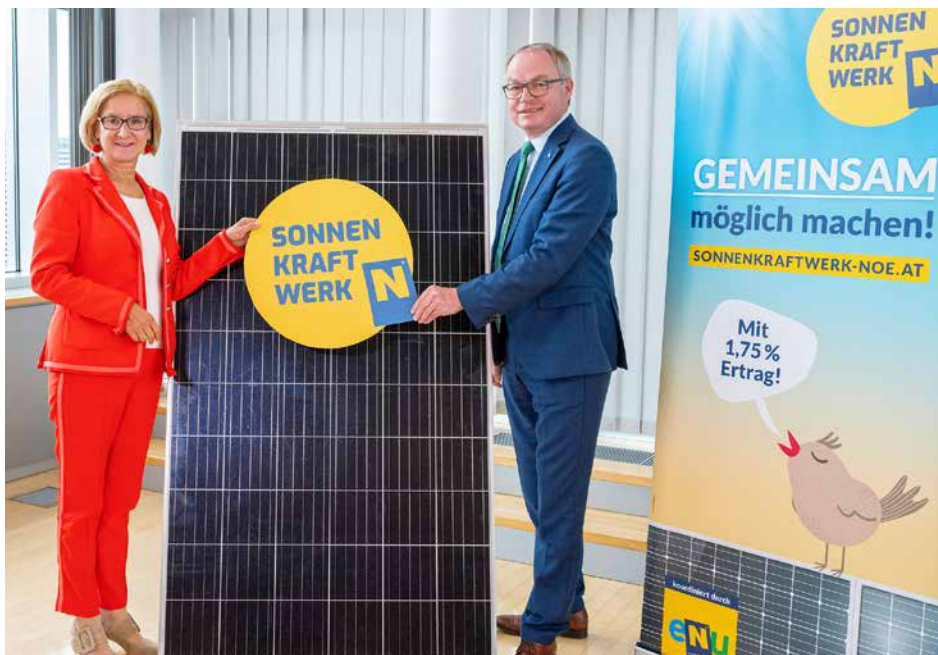
Freuen sich über das große Interesse am Sonnenkraftwerk NÖ: Landeshauptfrau Johanna Mikl-Leitner und LH-Stellvertreter Stephan Pernkopf.

Am Mittwoch, 18. November um 9 Uhr gab es zum Start des Sonnenkraftwerks NÖ 2.500 Paneele zu vergeben. Das Interesse am größten Photovoltaik-Bürgerbeteiligungsprojekt Europas ist enorm hoch. Bereits nach 13 Minuten waren alle Paneele reserviert. Das Land Niederösterreich arbeitet tatkräftig an den nächsten Kraftwerken, damit alle Interessenten zum Zug kommen.