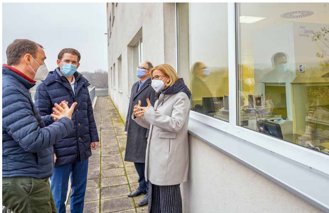
Landeshauptfrau Johanna Mikl-Leitner und Bundeskanzler Sebastian Kurz besuchten die Firma Polymun in Klosterneuburg.

Das Unternehmen Polymun mit Sitz in Klosterneuburg entwickelte ein spezielles Verfahren, damit der Impfstoff von BioNtech/Pfizer