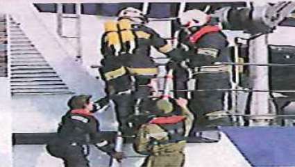
120 Florianis waren im Einsatz.

Übung. Simuliert wurde ein Feuerausbruch im Motorraum: 120 Florianis bekämpften den Brand und sicherten die Flussstrecke. 43 Passagiere wurden evakuiert und von 40 Rettungshelfern versorgt. (grp)