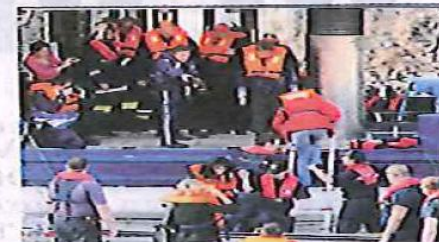
40 Rot-Kreuz-Retter halfen mit