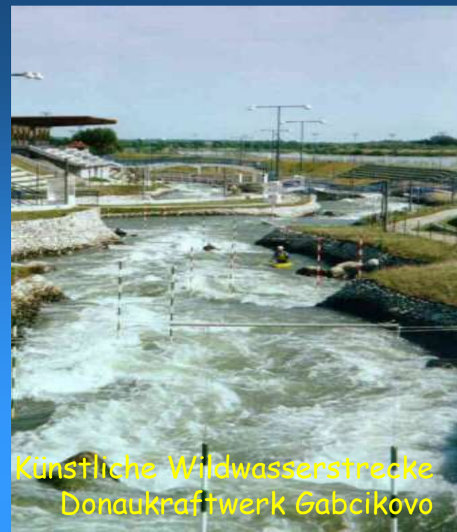
Künstliche Wildwasserstrecke Donaukraftwerk Gabčíkovo