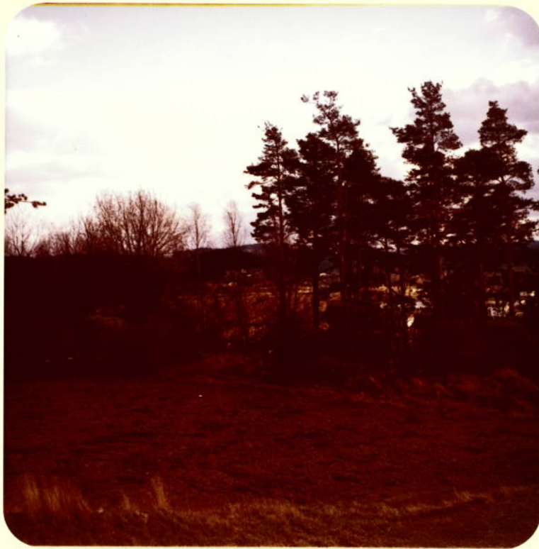
(Opferstein (Mitte) mit umliegenden Felsen, etwa aus Richtung Norden

Bescheid der BH. Zwettl vom 23.9.1980, Kennz. 9-N-8014/7